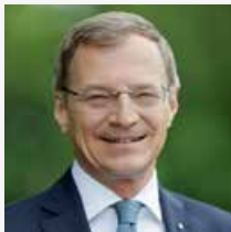
Mag. Thomas Stelzer Landeshauptmann

Mit diesem Folder wollen wir Information und Aufklärung rund um das Thema Cybermobbing bieten und vor allem auch einen Beitrag zur Sensibilisierung zu diesem immer wichtiger werdenden Thema leisten.