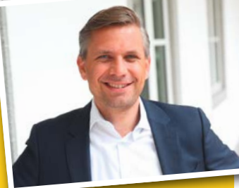
Ein Tipp von Wolfgang Hattmannsdorfer Jugend-Landesrat

Wenn Jugendliche in Oberösterreich eine Ausbildung im Pflege- und Gesundheitsbereich starten, gibt es ein eigenes Stipendium, um die Lebenserhaltungskosten decken zu können. Mit dem Oö. Pflegestipendium gibt es monatlich 600 Euro während der Ausbildung. Alle Infos sind unter www.ooe-pflegestipendium.at zusammengefasst.